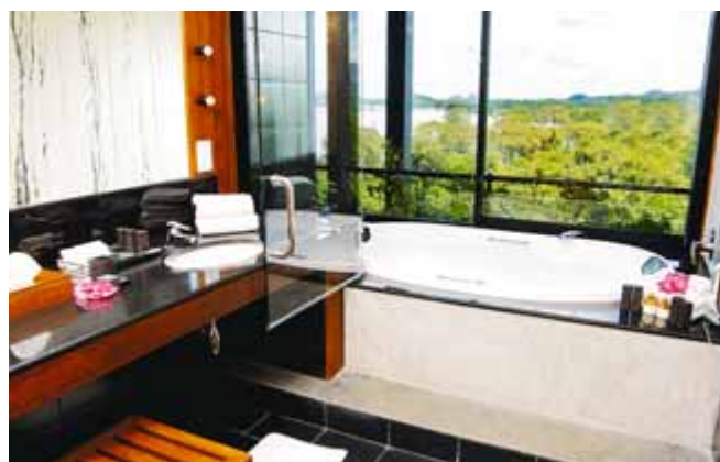
Aus dem Deluxe-Bathroom des »Kandalama« hat man eine tolle Aussicht direkt auf den Dschungel (links). In den einfachen Baumhäusern des »Rafter's Retreat« wohnt es sich recht abenteuerlich (rechts)