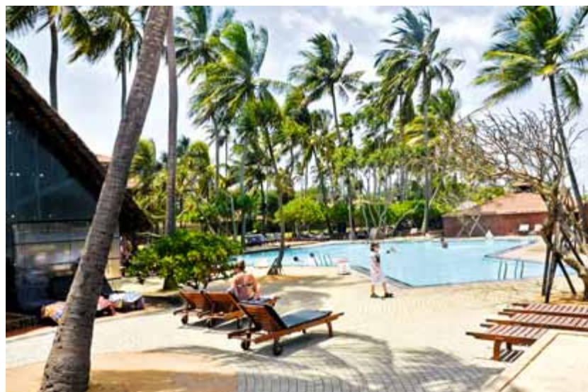
»Singharaja Garden«: Auf dem riesigen Hotelgrundstück befindet sich auch ein Naturpool mit Wasserfall (links). Entspannung bietet die Pool-Landschaft des »Ranweli Holiday Village« (rechts)